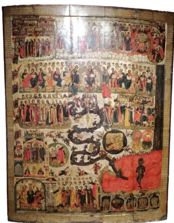
Das jüngste Gericht